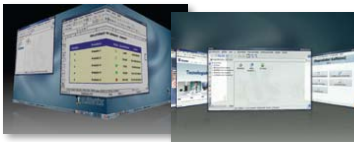
INTERFACE SOFISTICADA E AGRADÁVEL.

(* ) O bom funcionamento do aplicativo depende da placa de vídeo do computador.